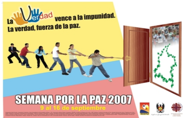
Afiche Semana por la Paz 2007